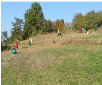
Kreuzrain bei Zazenhausen