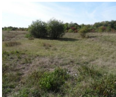
Vördere bei Kornwestheim