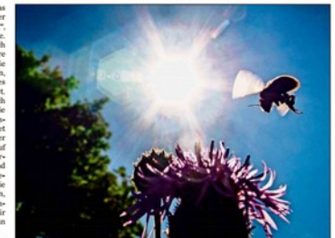
Der Insektenbestand geht teils dramatisch zurück. Besonders betroffen sind einige Wildbienen- und Schmetterlingsarten.