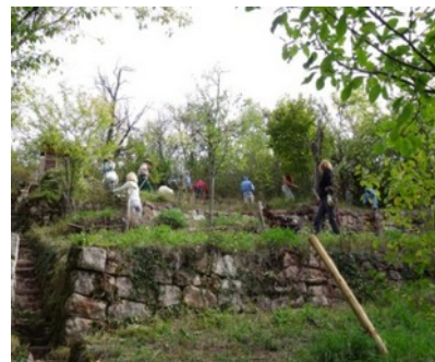
NABU-Grundstücke an der Wangener Höhe

Ehemalige Weinbergterrassen, heute Trockenrasen und Obstbäume