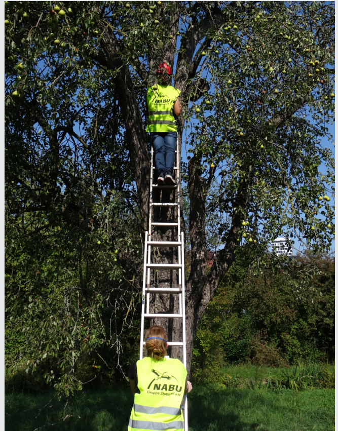
Bei der Nistkastenkontrolle.