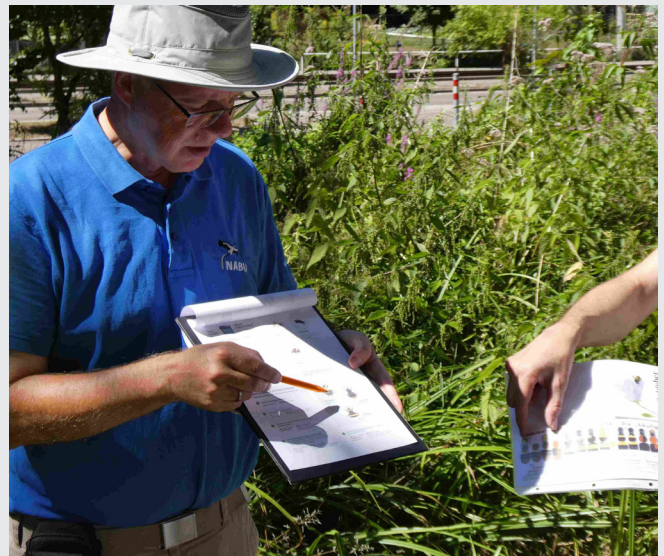
Der Zählbogen enthielt dieses Mal eine „Entdeckerfrage“ zu drei verschiedenen Hummelarten.