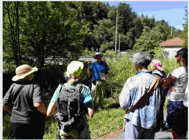
Der Exkursionsleiter gibt Erläuterungen zum Standort der Zählung.

Der Russische Bär landete im Ranking übrigens auf Platz 55. Noch ist es zu früh, aus der Aktion, die dieses Jahr zum 5. Mal stattfand, weitreichende Schlüsse zu ziehen, aber es konnten schon erste Trends abgelesen werden, z.B., dass sich die Blauschwarze Holzbiene ( Xylocopa violacea ), Deutschlands größte Wildbiene, die eigentlich aus Südeuropa stammt, in diesen fünf Jahren schon ein ganzes Stück weiter in den Norden Deutschlands ausgebreitet hat. kr