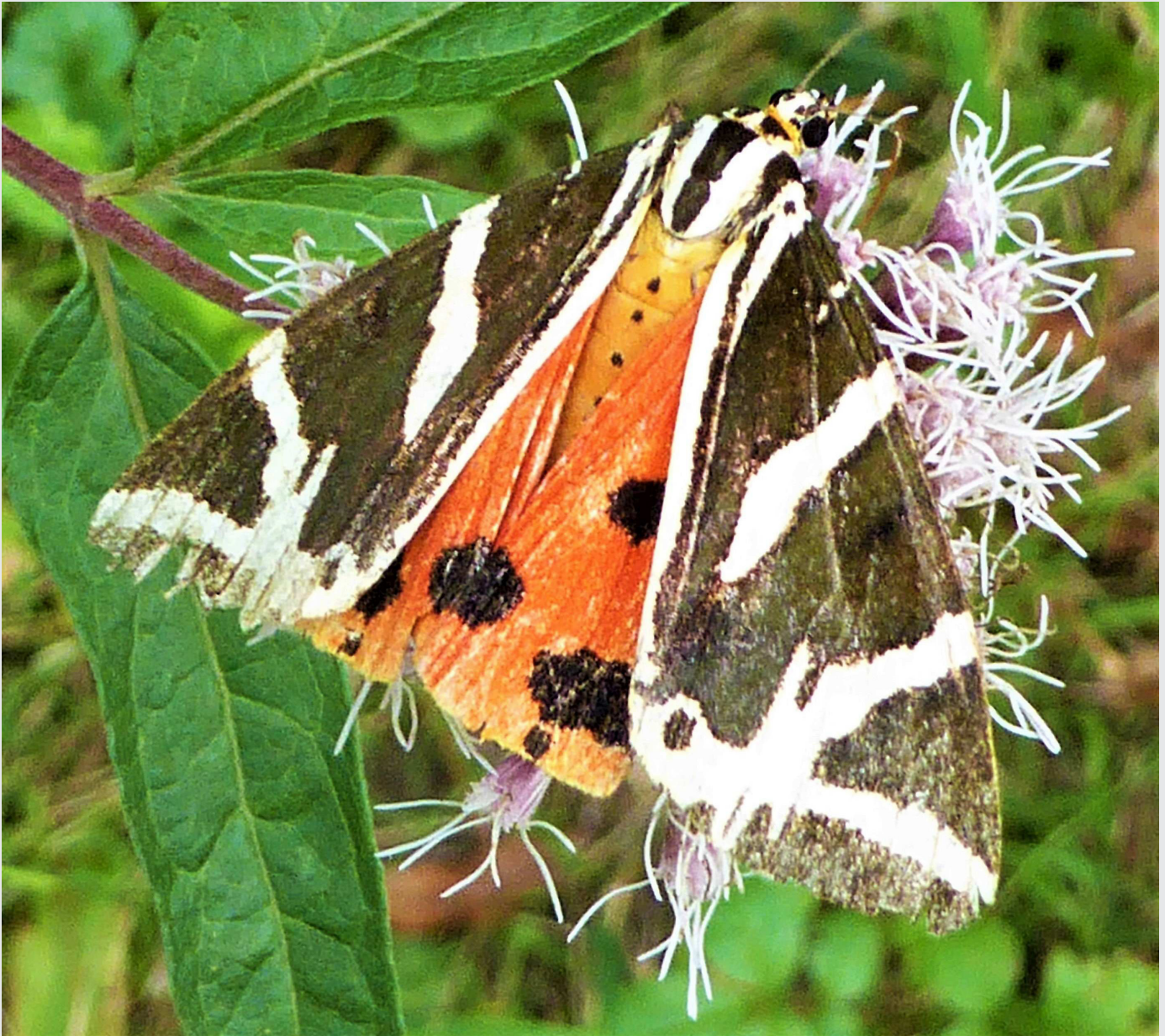
Unser Highlight der Insektenzählung – der Russische Bär.

Am 7. August fand während der zweiten Zählphase des NABU-Insektensommers unter nahezu optimalen Bedingungen (für optimale Bedingungen war es zu windig) eine von unserem Vorstand Stefan Kress geführte Exkursion mit Insekten-Zählung statt.