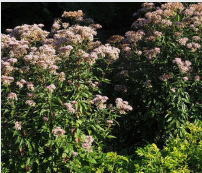
Den Russischen Bär haben wir auf Wasserdost entdeckt.