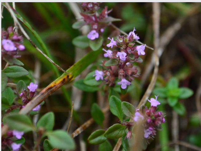
(oben) Arznei-Thymian am Kreuzrain. (rechts) Beim Pflegeeinsatz am Kreuzrain.

Dank der regelmäßigen Pflegeeinsätze wurde seit dem Jahr 2005 der Neuntöter wieder als regelmäßiger Brutvogel im Kreuzrain beobachtet. Der seltene Vogel benötigt Schlehen, Weißdorn, Pfaffenhütchen, Essigrose, Schlehe und Weißdorn zur Nestanlage und zum Aufspießen seiner Nahrung.