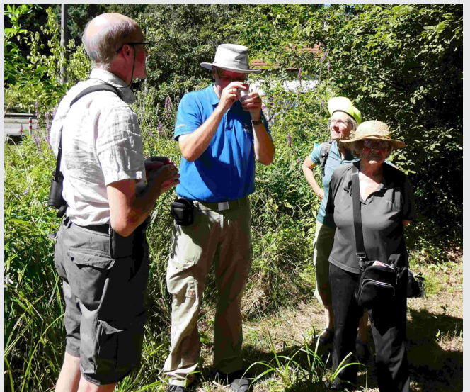
Bei manchen Sechsheinern musste ganz genau hingeschaut werden.