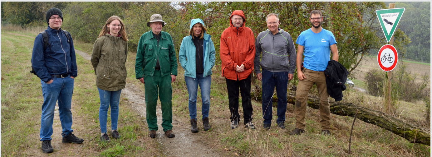
Die Teilnehmer vom diesjährigen Einsatz am Kreuzrain.

Im Jahr 2000 hat der NABU Stuttgart die Pflegepatenschaft für das nach §32 Naturschutzgesetz besonders geschützte Biotop „Trespen-Halbtrockenrasen Kreuzrain in Zazenhausen“ für die Stadt Stuttgart übernommen. Die Fläche ist Teil des Naturschutzgebietes „Unteres Feuerbachtal mit Hangwäldern und Umgebung“ und gilt wegen seiner besonderen Vegetation und seiner spezifischen Flora als wertvoll für das Stuttgarter Stadtgebiet.