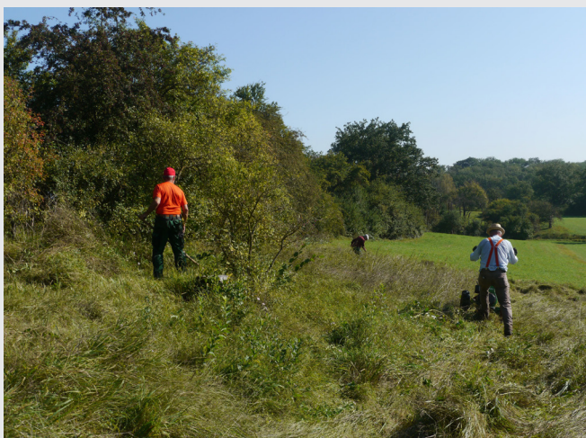
Beim Pflegeeinsatz am Kreuzrain.

Deshalb meine Bitte: Stellen Sie Ihre Fähigkeiten dem NABU Stuttgart und damit einer hoffnungsvollen Zukunft zur Verfügung. Die Zusammenarbeit mit uns kommt beiden Seiten, aber insbesondere auch den Kindern und Jugendlichen zu Gute. Die Zukunft braucht Wissen und Handeln bezüglich der Natur, NATurschutz Braucht Uns gemeinsam. hpk