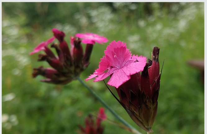
Karthäusernelke am Kreuzrain.

Bitte melden Sie sich unter nabu@nabu-stuttgart.de oder telefonisch unter 0711 626944